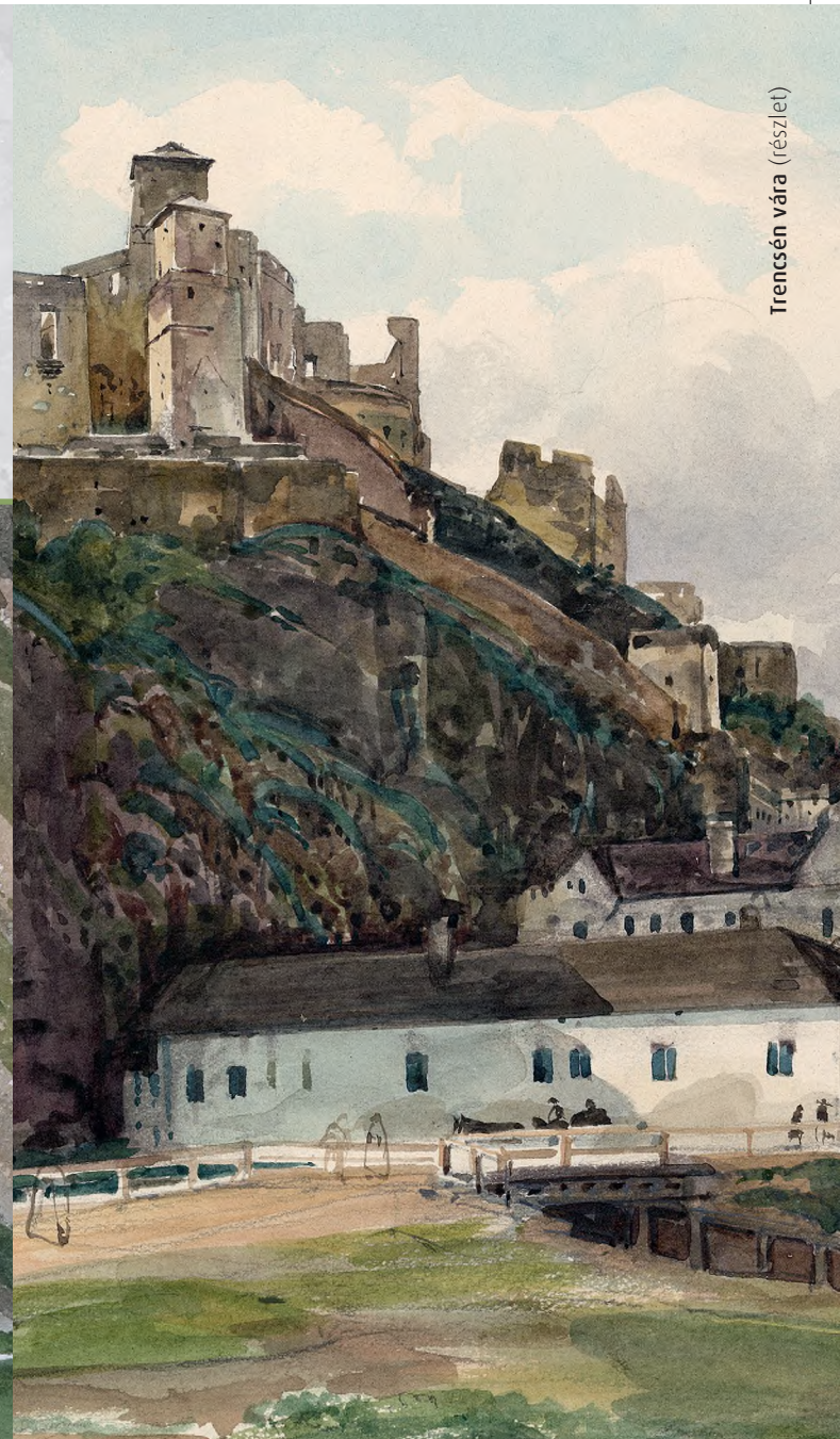
Trencsén vára (részlet)