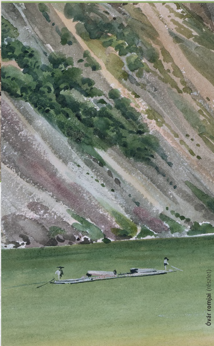
Óvár romjai (részlet)

Thomas Ender (1793–1875) tizenkét éves korától tanult a bécsi Képzőművészeti Akadémián. 1829-től Habsburg János főherceg alkalmazta udvari festőként. Ender az 1860-as évek első felében járt Magyarországon. Az elkészült akvarellek tanúsága szerint Ender egy vasút tervezett útvonala mentén tett „festői kirándulásokat” a Vág völgyében, a Magas- és a Lengyel-Tátrában, a Szepességben. Felvidéki útjának egyetlen dokumentálható eseménye nagyőri tartózkodása: a Mednyánszkyak 1861-ben költöztek át ősi fészükéből, Beckóból a nagyőri kastélyba, ahol a családi hagyomány szerint Ender az akkor tizenkét-tizenhárom éves Mednyánszky Lászlót taníttatta rajzolni.