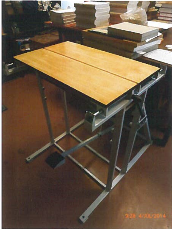
1-2.- az új ragasztó-kötőgép